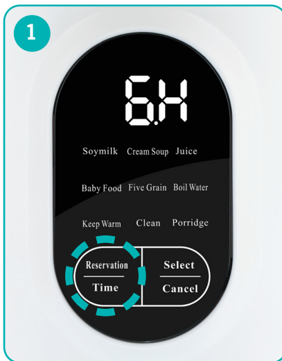
Increase timer by pressing the Reservation/Time key repeatedly