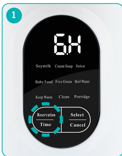
Időzítés kiválasztása a Reservation/Time gomb többszöri megnyomásával