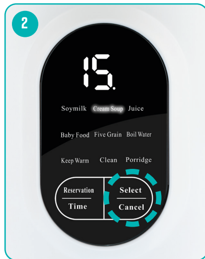
Select timed function by pressing the Select/Cancel key repeatedly