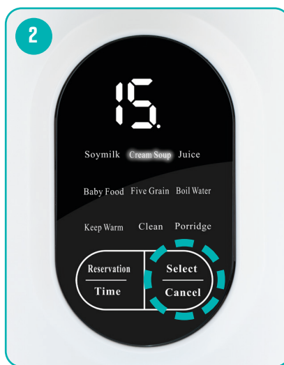
Időzített program kiválasztása a Select/Cancel gomb többszöri megnyomásával